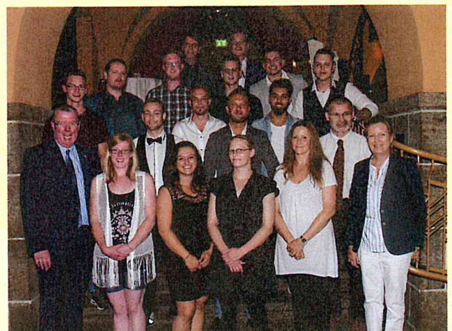
Freigesprochene Gesellinnen und Gesellen der Landesinnung Bremen und Nord-West-Niedersachsen.

Landesinnung Bremen und Nord-West-Niedersachsen des Gebäudereiniger-Handwerks 28195 Bremen Tel.: 0 421 / 222 80 – 611