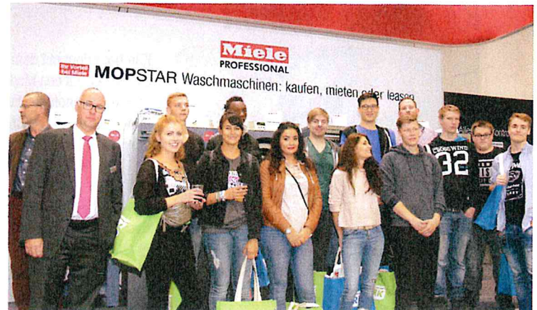
Wäschereitechnik stand beim Besuch am Miele-Stand im Vordergrund.