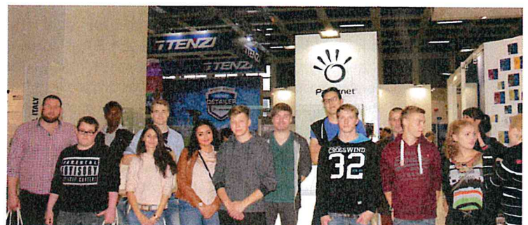
Am Stand von Papernet gab es Infos zur Sanitärhygiene.