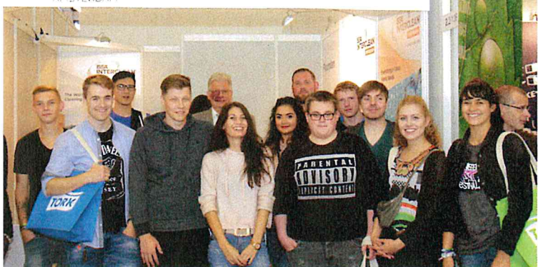
Die ISSA veranstaltet gemeinsam mit der Knittler Medien GmbH den JEZ Award.