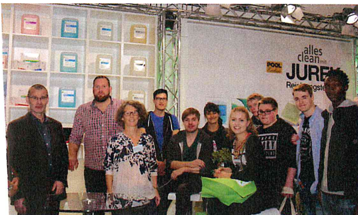
Die Schulklasse zu Gast bei der Mobiloclean-Handelsgruppe.

Weitere Fotos der Siegerklasse auf der Reinigungs Markt Facebook-Seite unter dem Kurzlink: http://t1p.de/JEZ2017