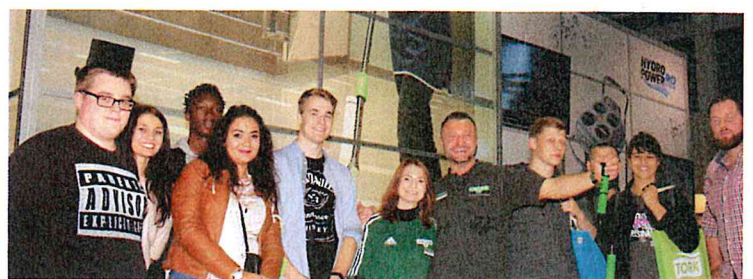
Bei Unger informierten sich die der Bremer Schüler ebenfalls über die CMS-Neuheiten.