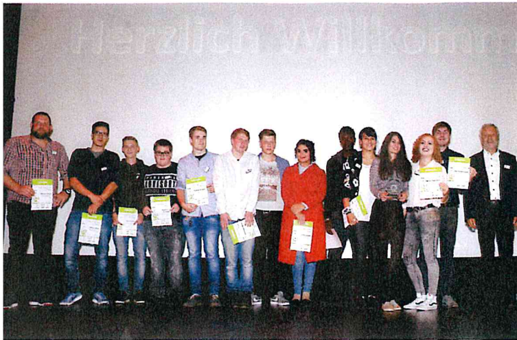
Der Sieg ging 2017 an die Gebäudereinigerklasse 16 des Schulzentrum Sekundarbereich II an der Alwin-Lonke-Straße in Bremen.